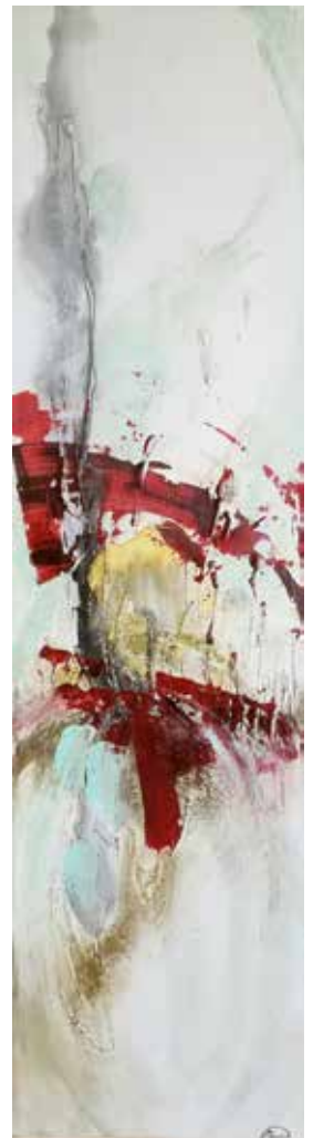
Lot 200 de l'encan numérique: Parfum épuré , toile de Patricia Kramer

Au nom de la Fondation du Musée POP, nous vous remercions de votre présence à cet encan de vins de prestige et vous souhaitons une bonne fin de soirée.